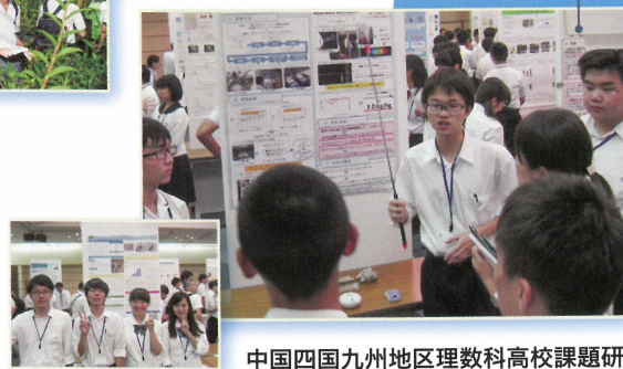
中国四国九州地区理数科高校課題研究発表大会