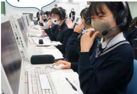
▲オンラインでの姉妹校交流