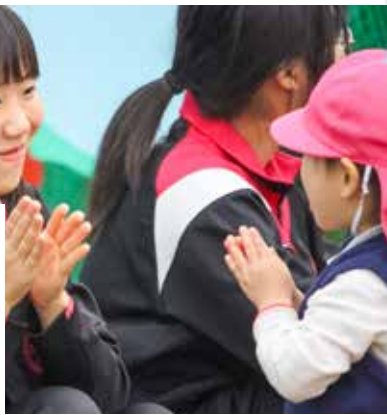
▲幼稚園で社会貢献活動