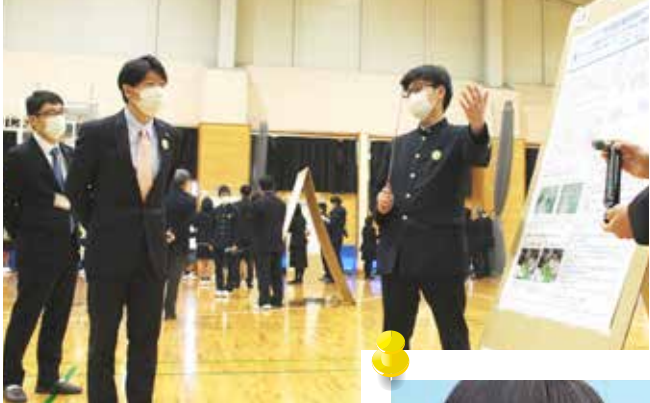
▲探究活動プレゼンテーションアワード