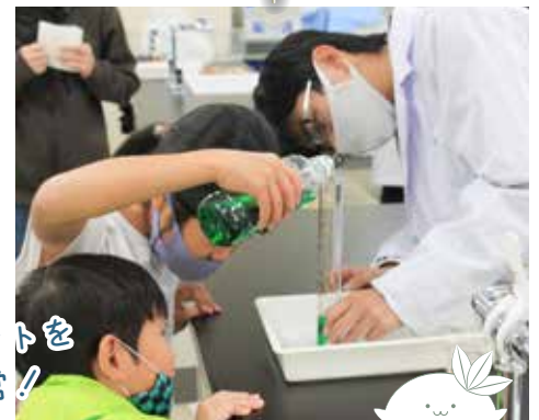
▲サイエンスフェア