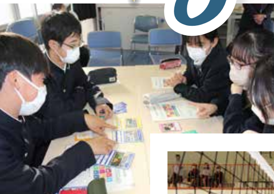
▲多文化共生ワークショップ

勉強も部活動も頑張りたい！国際交流や海外留学に挑戦したい！ 地域に貢献する活動がしたい！輝く君たちを応援します！