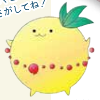
玉島高校 マスコットキャラクター 「たまっこ」