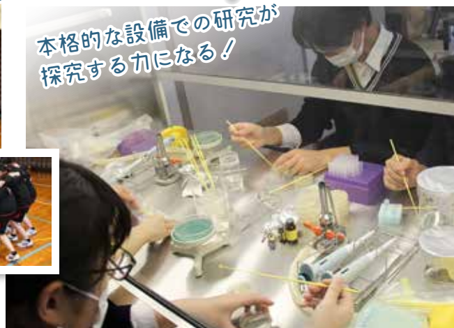
▲理数科 ハイパーサイエンスラボ