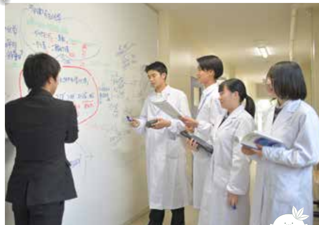
▲壁一面がホワイトボードで議論白熱