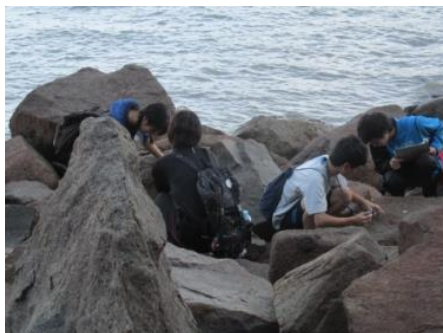
調査の様子（沙美東海岸）