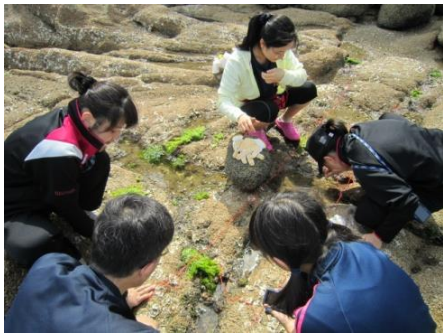
調査の様子（沙美東海岸）

玉島高校近隣の海岸で潮間帯生物の調査を行った。調査したデータをまとめ、企業の担当者から TV 会議システムで助言をいただいた。また、研究結果をポスターにまとめ愛媛大学で発表。