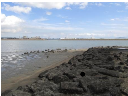
高梁川河口付近の海岸

玉島高校近隣の海岸で、調査手法を改善して潮間帯生物の調査を行い、ポスターにまとめて神戸大学での「私の科学研究発表会」へ参加した。（奨励賞）