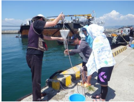
プランクトン採集