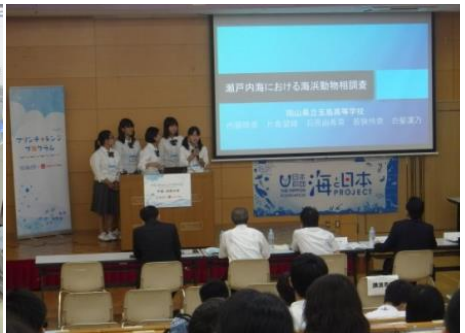
愛媛大学での発表