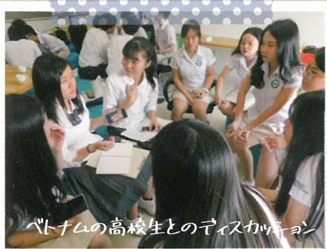
ベトナムの高校生とのディスカッション