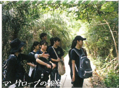
マングローブの観審