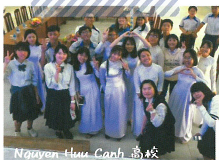
Nguyen Huu Canh 高校