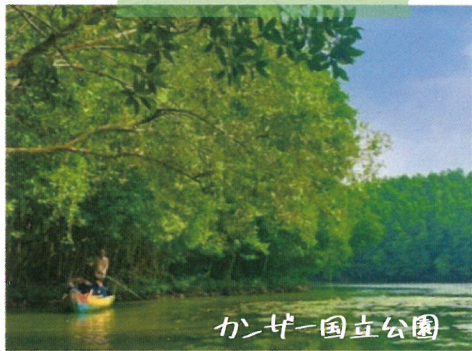
カンザー国立公園