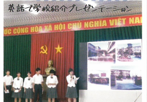
英語で学校紹介プレゼンテーション

英語のコミュニケーションって難しい!でも「イ云わり」ってうれしい楽しい! 英語が話せるようになりたい!