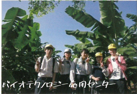
バイオテクノロジー応用センター