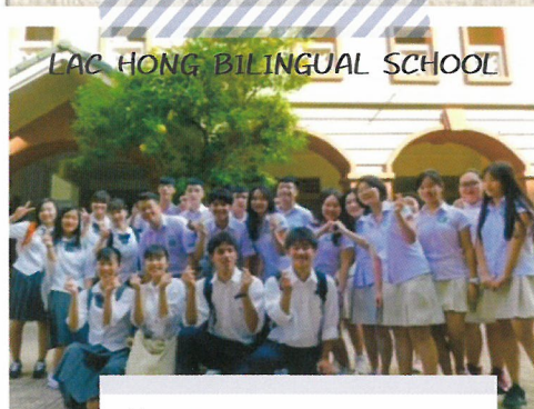
LAC HONG BILINGUAL SCHOOL